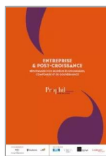
Entreprise et post-croissance